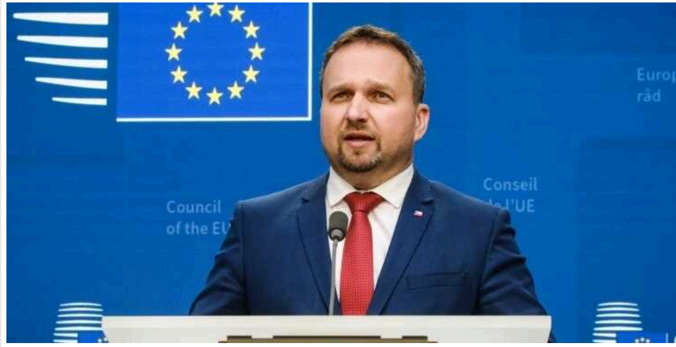
Проводив вечірку під час стрілянини в Празі: чеський міністр може піти у відставку, — ЗМІ

За словами Маріана Юречки, він не до кінця усвідомлював масштаби трагедії після стрілянини в Карловому університеті. За деякими даними, після завершення екстреного засідання уряду політик повернувся на захід.