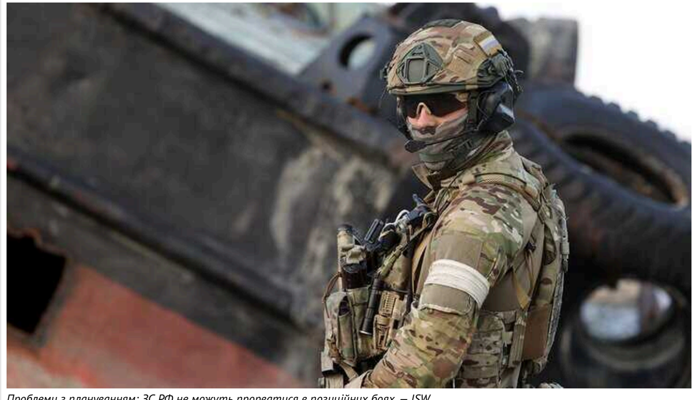
Проблеми з плануванням: ЗС РФ не можуть прорватися в позиційних боях, — ISW

За словами аналітиків, немає ознак того, що російські сили покращили свої можливості щодо планування та координації. Тому й триває дорогий і безладний наступ під Авдіївкою.