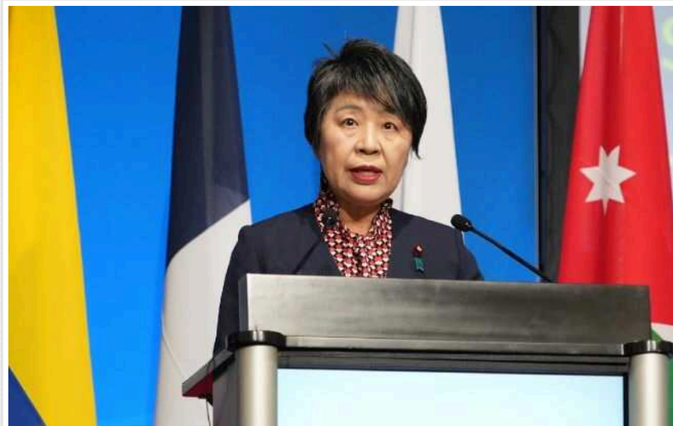
Японія виділила 37 мільйонів доларів на системи виявлення дронів для України

Японія виділяє для допомоги Україні 37 млн доларів. Їх спрямують на закупівлю систем для виявлення дронів.