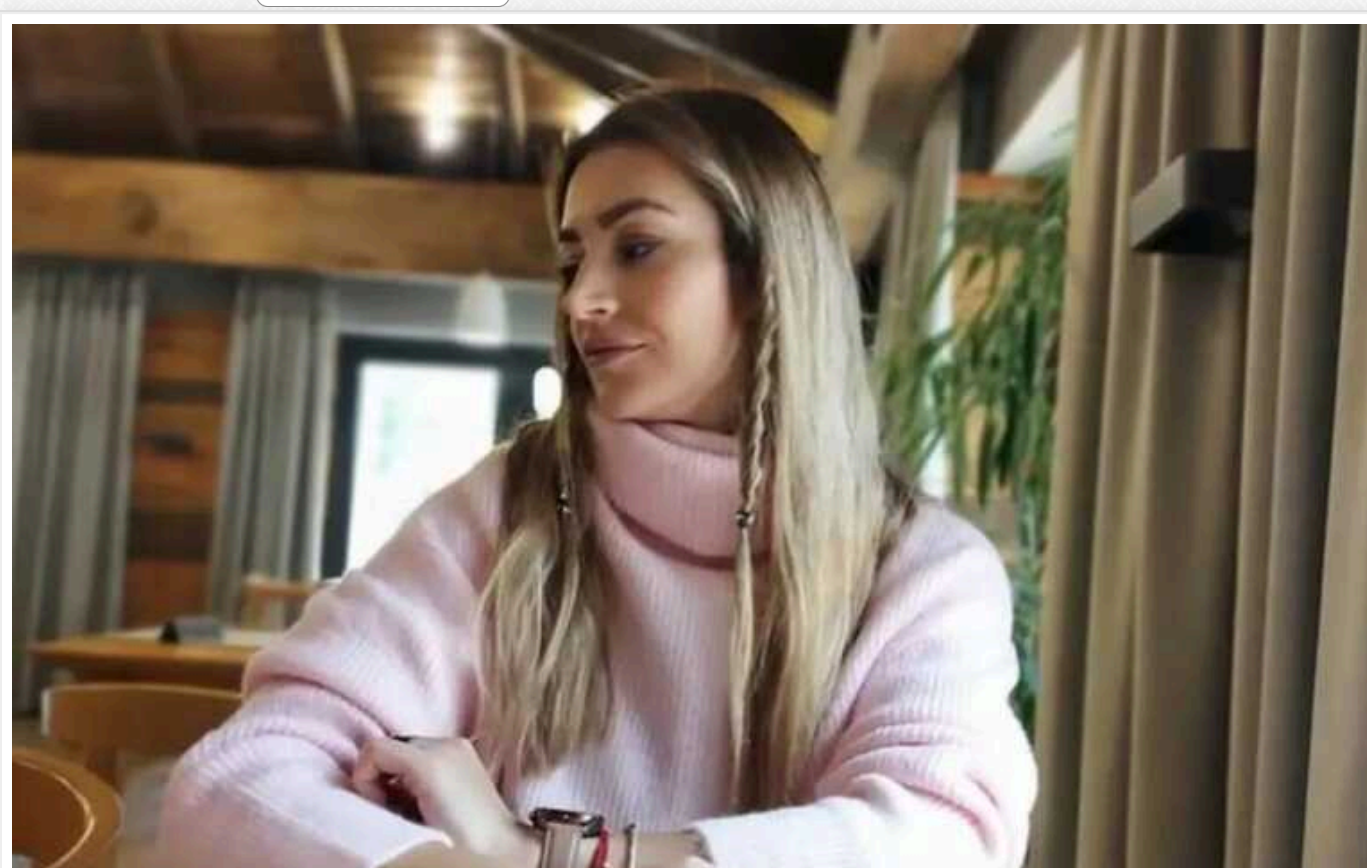
Скандал "Кварталу 95" із піснею Хурсенка: дочка відомого музиканта – про шок від виступу, подарунок від Білик і співпрацю тата з Байрак

Читати на російськом Додати як бажане джерело в Google