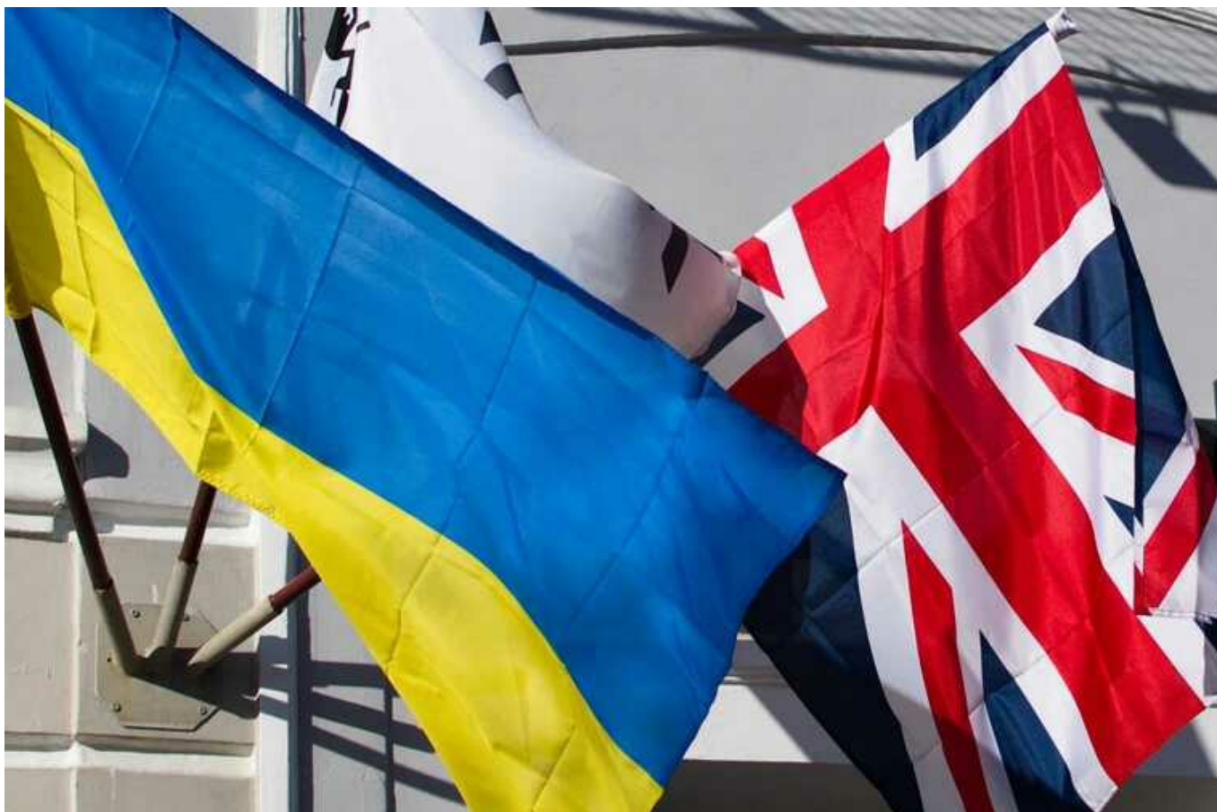
Велика Британія готує план Б для продовження допомоги Україні без США

Велика Британія сьогодні демонструє найбільший запал у підтримці України, певною мірою протиставляючи себе елітам США та ЄС, які останнім часом дещо завагалися у цьому напрямку через внутрішні протиріччя.