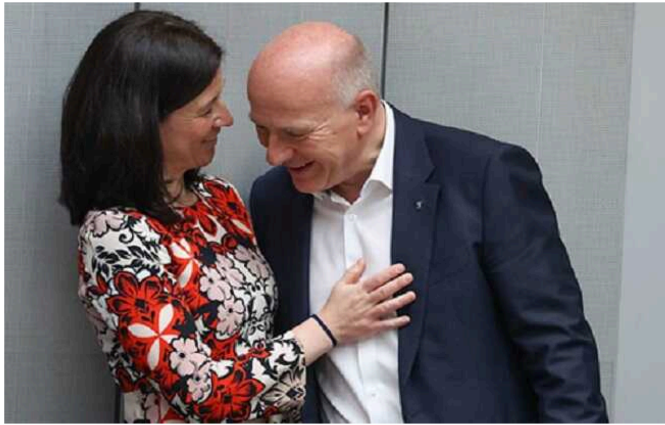
Бургомістра Берліна хочуть відправити у відставку через службовий роман

У німецькій столиці спалахнув скандал через службовий роман бургомістра (міський голова – ред.) Кая Вегнера.