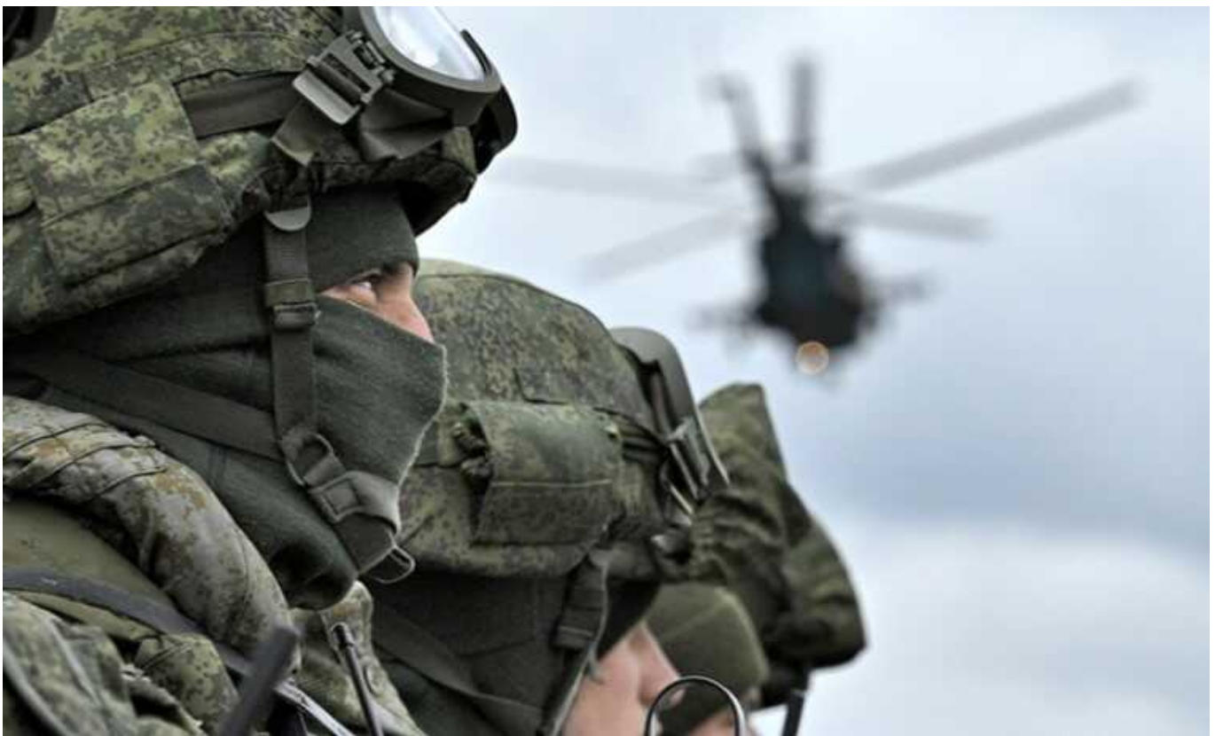
ISW: ЗС РФ стягують резерви в районі Кременної для нових штурмів

Російські окупаційні війська стягують резерви в районі Кременної та готуються до нових штурмів поблизу Невського та Білогорівки в Луганській області.