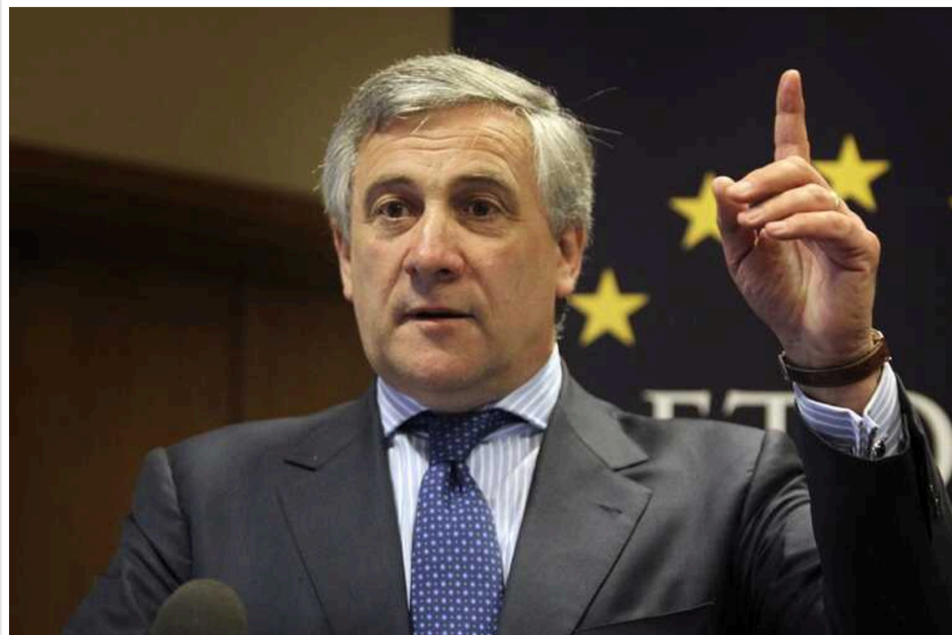
ЄС має сформувати власну армію: змогла б зіграти роль у підтримці миру та запобіганні конфліктам

Для підтримки миру та запобігання конфліктам Євросоюз має сформувати власну армію.