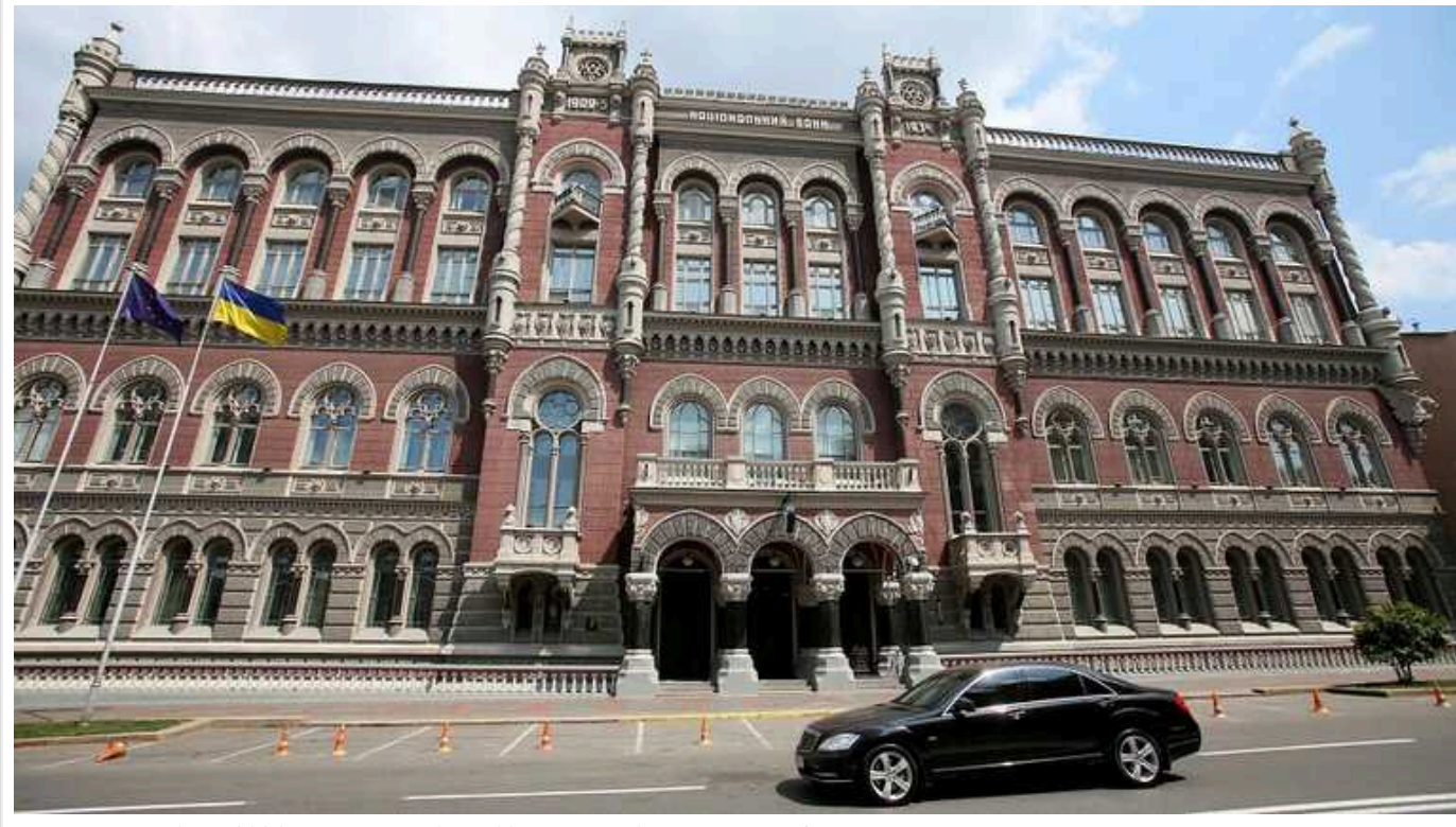
У перший тиждень 2024 року НБУ продав 789 мільйонів доларів на міжбанку

Національний банк за тиждень з 1 по 5 січня на міжбанківському валютному ринку продав 789,5 млн доларів і купив 0,2 млн доларів.