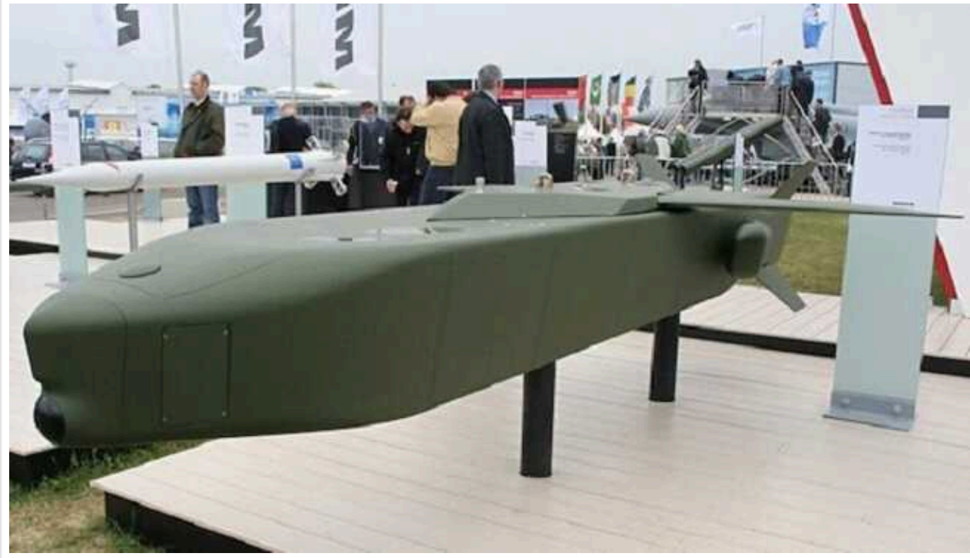
Прем'єр Баварії та експрезидент Німеччини виступили за надання Україні ракет Taugus

Прем'єр-міністр Баварії, голова Християнсько-соціального союзу (ХСС) Маркус Зьодер заявив, що Німеччина повинна поставити далекобійні крилаті ракети в Україну.