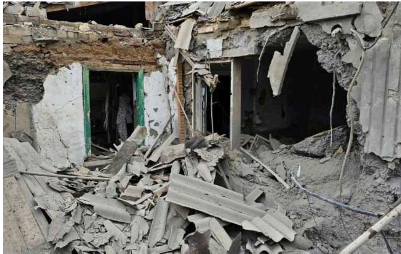
Окупанти обстрілюють Херсон: кількість загиблих та поранених зроста

Херсон протягом дня знаходиться під огнем росіян. Внаслідок влучення по житловому будинку загинула жінка.