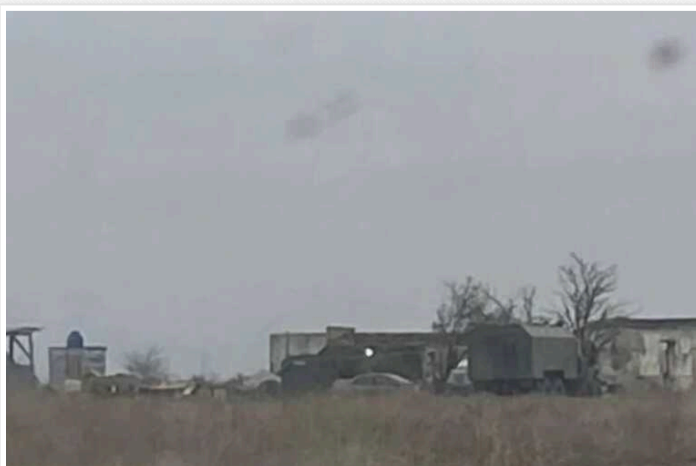
У Криму агенти "Атеш" виявили нову ремонтну базу окупантів

Російська терористична армія продовжує створювати нові ремонтні бази у тимчасово окупованому Криму. Чергове місце дислокації загарбників виявили біля Євпаторії.