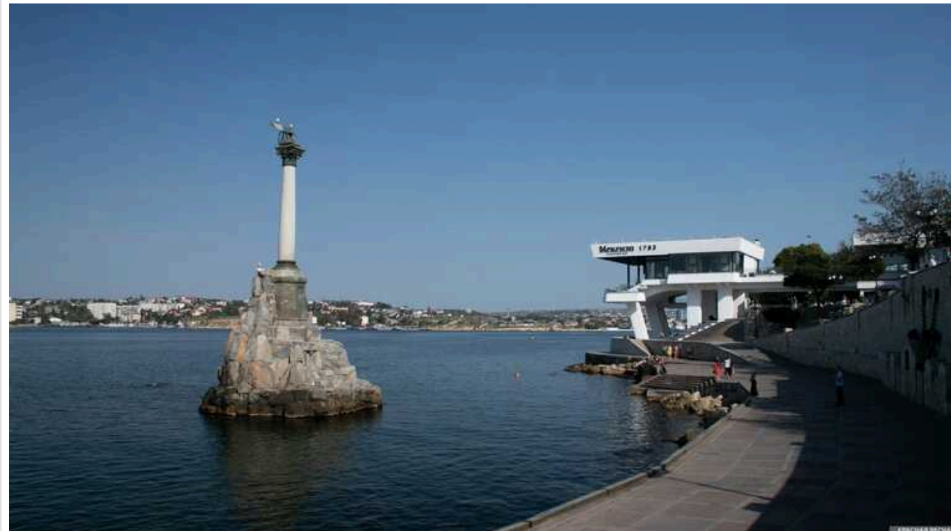
РФ могла перекинути до Севастополя новий десантний корабель, - ЗМІ

До Севастополя з Новоросійська Російської Федерації, ймовірно, було дислоковано новітній великий десантний корабель.