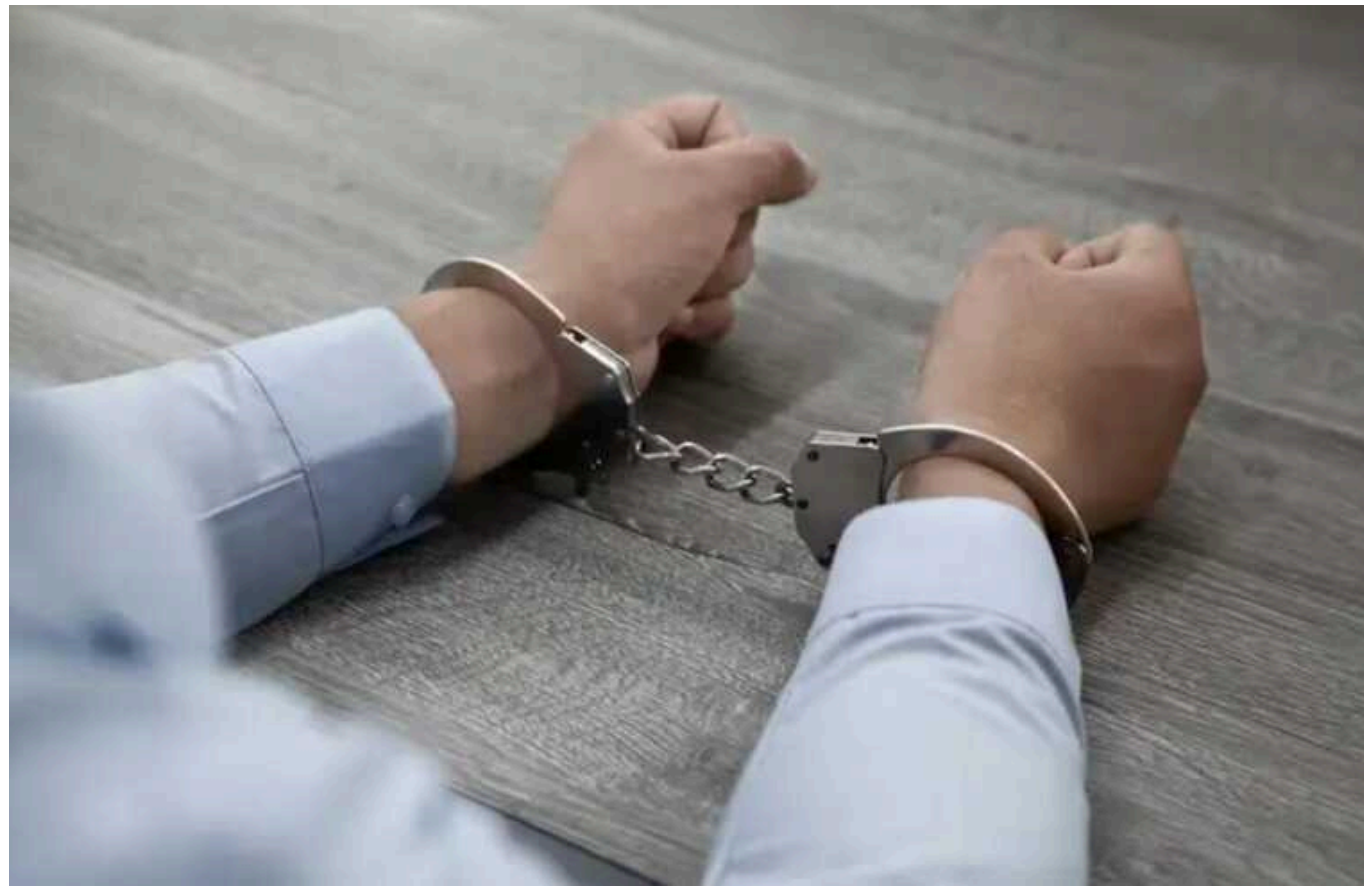
Туреччина заявила про ув'язнення 15 підозрюваних у шпигунстві на користь Ізраїлю

Суд у Стамбулі постановив арештувати 15 з 34 осіб, затриманих за підозрою у шпигунстві на користь ізраїльської служби зовнішньої розвідки "Моссад".