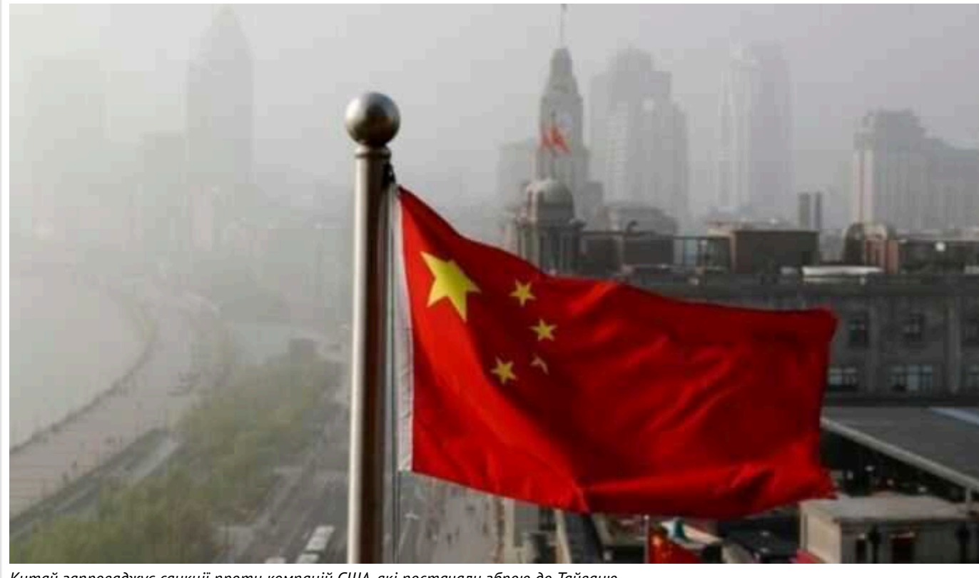
Китай запроваджує санкції проти компаній США, які постачали зброю до Тайваню

Китай запроваджує санкції проти п'яти компаній США через постачання зброї Тайваню.