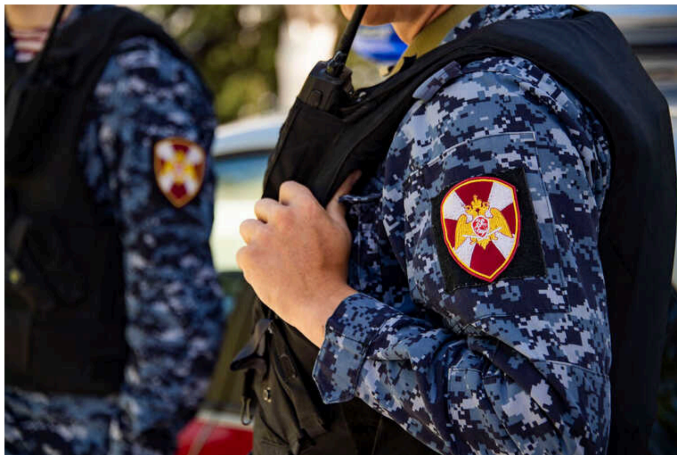
Росія підвищує боєздатність Росгвардії – британська розвідка

Розвідка Великої Британії зазначає, що Росгвардія зміцнює свої ресурси та особовий склад на тлі потрясінь у сфері внутрішньої безпеки Росії, спричинених війною проти України.