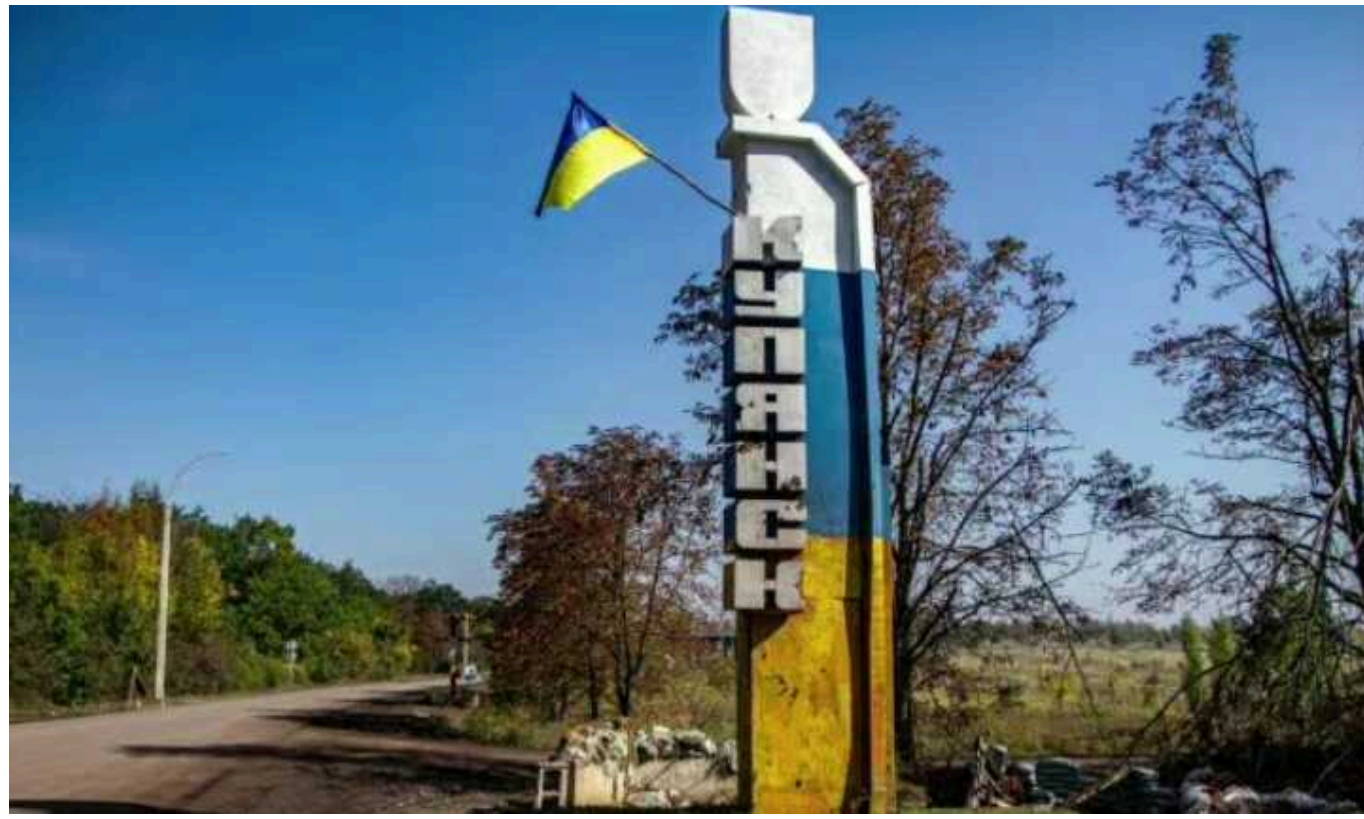
Окупанти зосередили свої атаки на Куп'янському напрямку, – ОВА

Останніми днями росіяни зосередили зусилля на Куп'янському напрямку, намагаються прорвати оборону захисників.