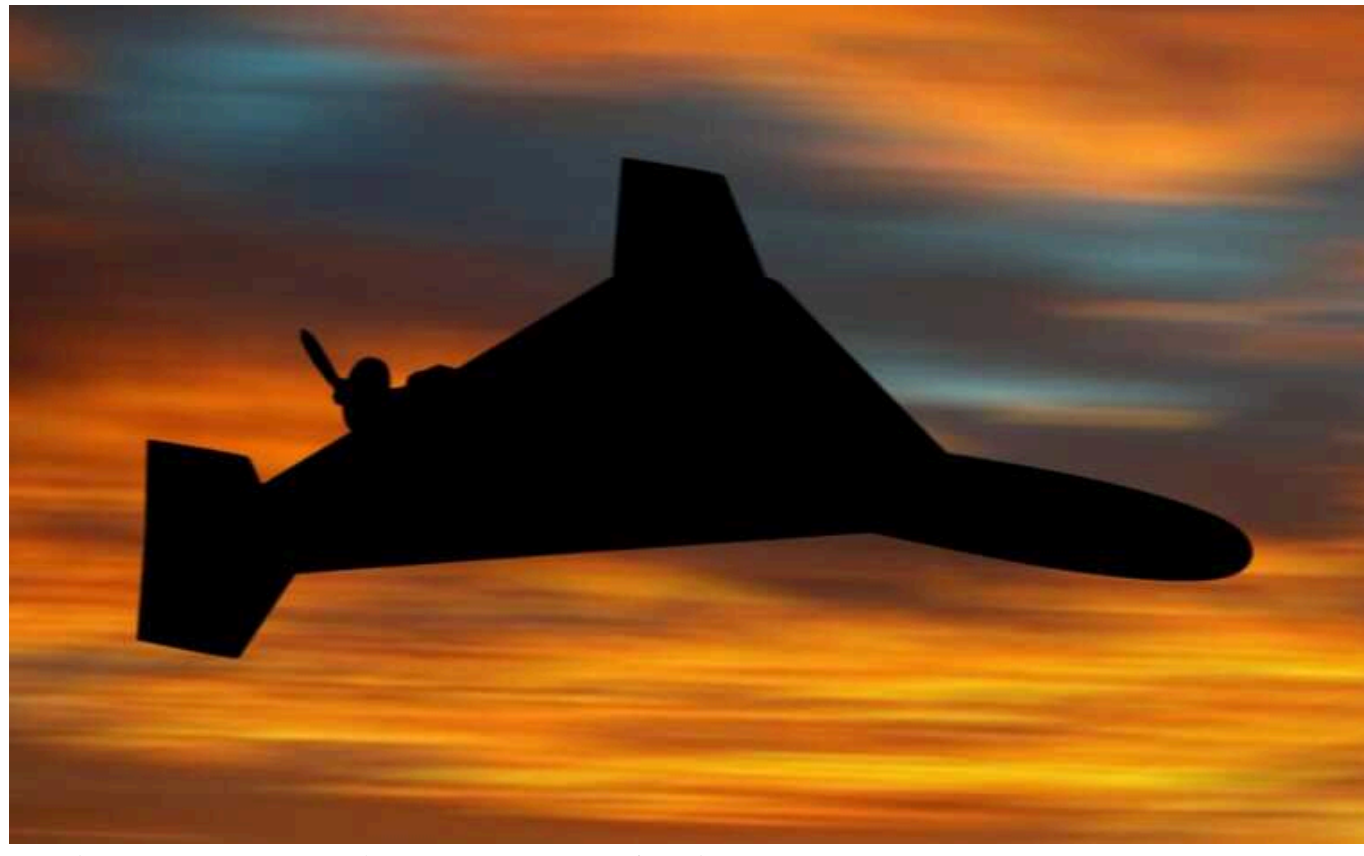
Внаслідок влучання ворожого БПЛА на Миколаївщині горіла база відпочинку

Увечері, 6 січня, відбулось влучання БПЛА типу "Shahed-131/136" у рекреаційній зоні, внаслідок чого на одній із законсервованих баз відпочинку у Миколаївській області сталося займання.