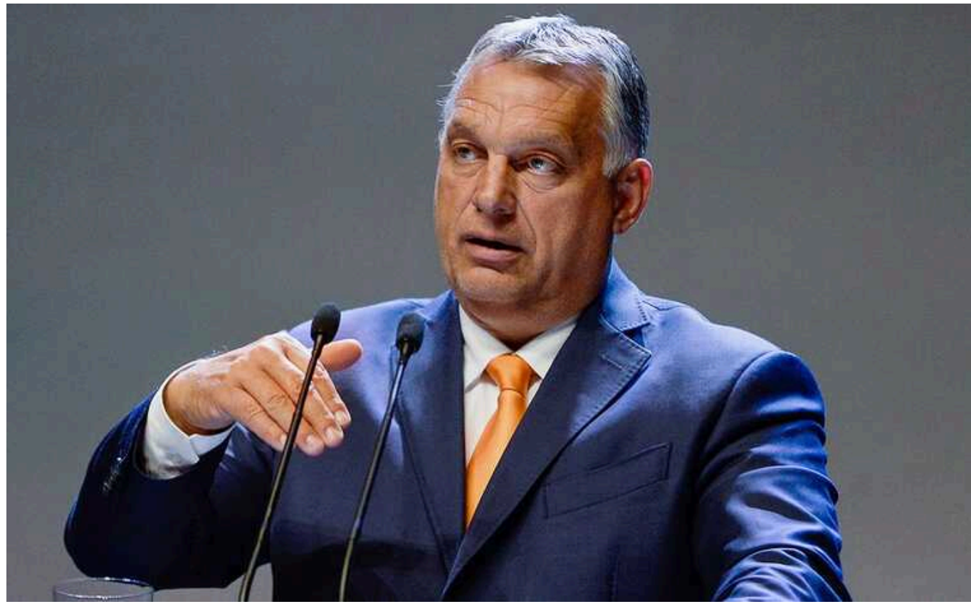
У разі відставки Шарля Мішеля тимчасовим президентом Євросоюзу може стати Орбан

Якщо чинний президент Європейської ради Шарль Мішель залишить свою посаду у липні, як він раніше анонсував, лідери ЄС повинні будуть швидко домовитися про наступника.