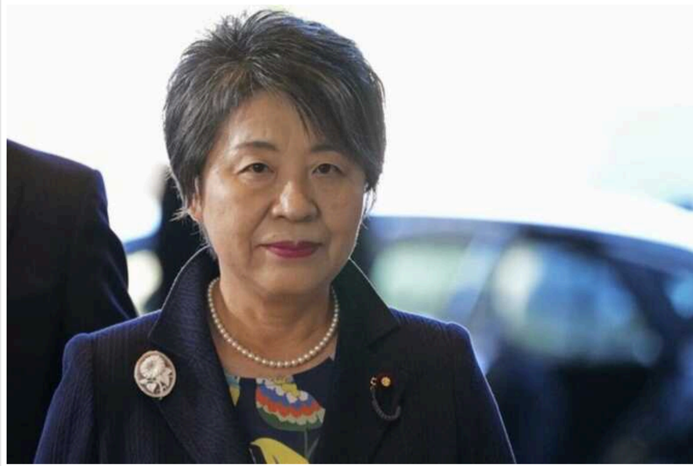
7 січня Україну відвідає глава МЗС Японії

7 січня Україну з візитом відвідає міністр закордонних справ Японії Йоко Камікава, яка проведе зустрічі в Києві, зокрема з міністром закордонних справ України Дмитром Кулебою.