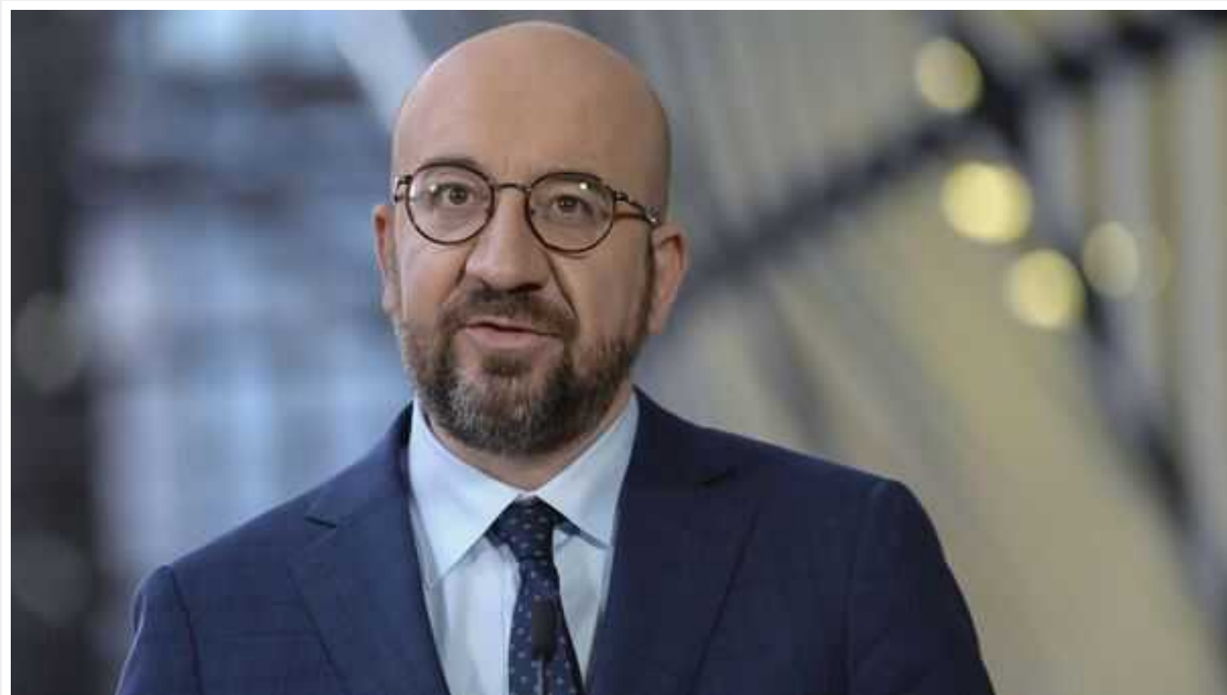
Президент Євроради Шарль Мішель може піти у відставку

Президент Європейської ради Шарль Мішель може достроково залишити займану посаду. Він має намір взяти участь у виборах до Європейського парламенту.