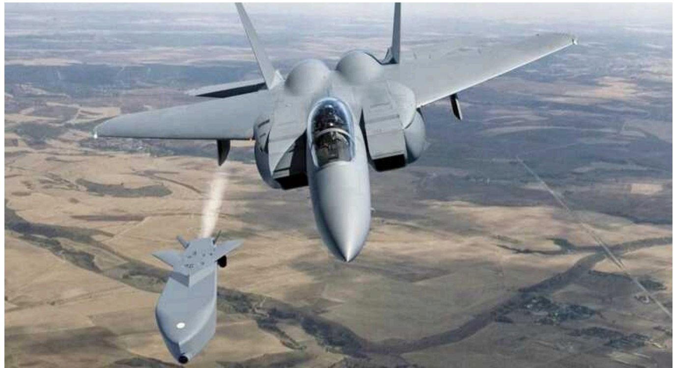
Україна намагається послабити ППО окупантів над Кримом, - ISW

Українські війська проводять багатоденну кампанію з нанесення ударів по російських військових об'єктах у тимчасово окупованому Криму і вже успішно вразили кілька цілей у різних районах півострову.