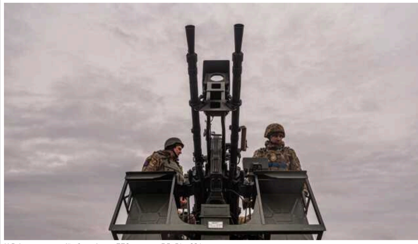
У Дніпропетровській області сили ППО знищили 7 БЛА, - ОВА

Російські війська атакували Дніпропетровську область ударними дронами вчора ввечері, 6 січня. Силами ППО було знищено 7 безпілотників.