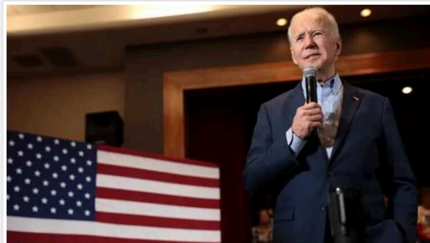
Сполучені штати готові заборонити Байдену участь у президентських праймеризах, якщо до них не допустять Трампа

У США почали обговорювати можливість не допустити Джо Байдена до президентських праймеріз, аналогічно до ситуації з Дональдом Трампом.