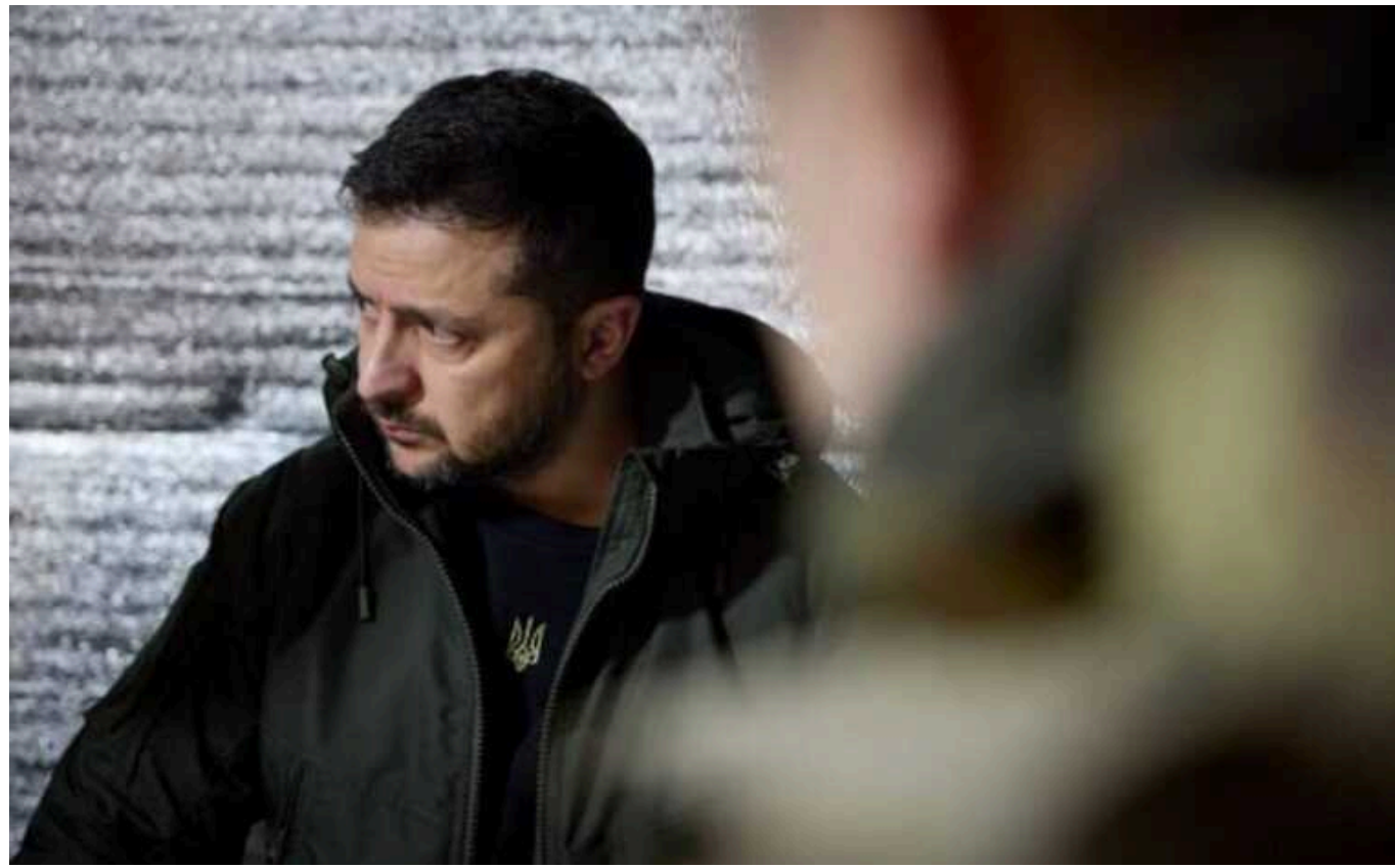
Чому Захід не поспішає нарощувати допомогу Україні, - думка Британського експерта

Захід не вірить у те, що президент РФ Володимир Путін атакує НАТО, тому не поспішає нарощувати допомогу Україні.