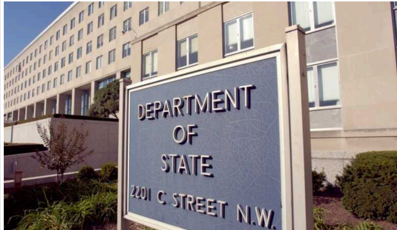
У Держдепі США оголосили винагороду за інформацію про джерела фінансування ХАМАСу

Державний департамент США готовий виплатити 10 мільйонів доларів тому, хто надасть дані, що допоможуть розкрити й надалі зруйнувати міжнародні механізми фінансування бойовиків руху ХАМАС.