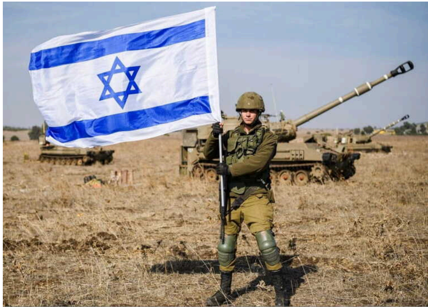
Розвідка Ізраїлю чотири рази попереджала про ймовірний наступ ХАМАС у жовтні 2023-го – ЗМІ

Керівник одного з підрозділів розвідки ЦАХАЛ чотири рази попереджав про те, що терористи ХАМАС можуть готуватися до нападу на Ізраїль. Він письмово та усно звертався до всіх високопоставлених представників військового та політичного керівництва держави з застереженням, що впевненість у тому, що бойовики не підуть на конфронтацію, є хибним.