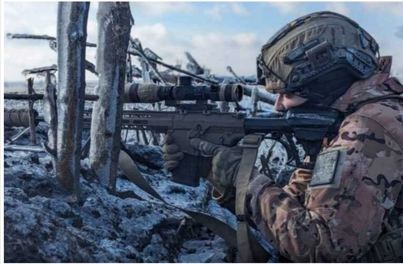
Окупанти протягом дня 18 разів безуспішно штурмували плацдарм на лівому березі Дніпра, - Генштаб

Генштаб ЗСУ оприлюднив інформацію щодо ситуації на плацдармах ЗСУ на лівому березі Дніпра поблизу Херсону 6 січня 2024 року.