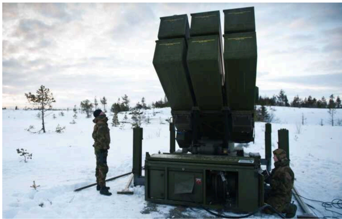
На Заході – гостра проблема з виробництвом зброї, Китай і РФ випереджають у цьому – WSJ

Війна Росії проти України виявила недоліки на Заході щодо швидкого виробництва більшої кількості зброї у потрібний момент. Головна проблема полягає в тому, що сучасна зброя надзвичайно складна та часто вимагає тисяч деталей.