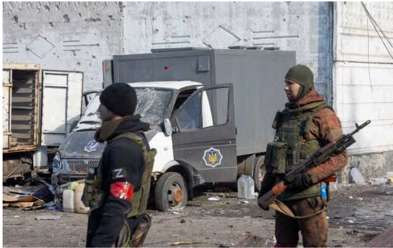
Окупанти на окупованих територіях продовжують грабувати українців, - Федоров

Російські окупанти продовжують грабувати українців на тимчасово окупованих територіях.