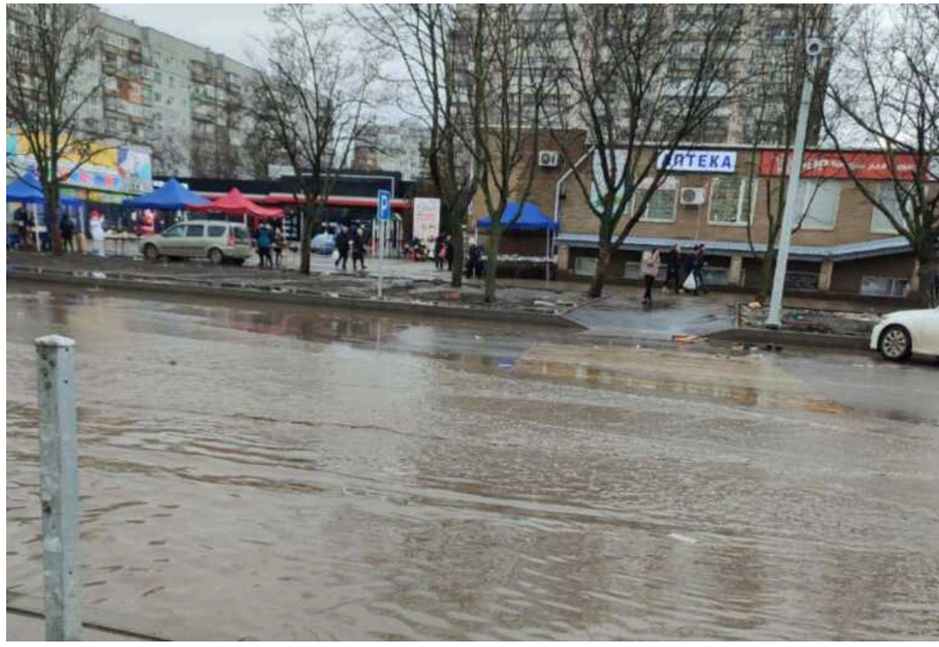
В окупованому Маріуполі місцеві б'ють на сполох: каналізація топить підвали

В окупованому Маріуполі окупаційна влада не реагує на скарги місцевих щодо затоплених підвалів.