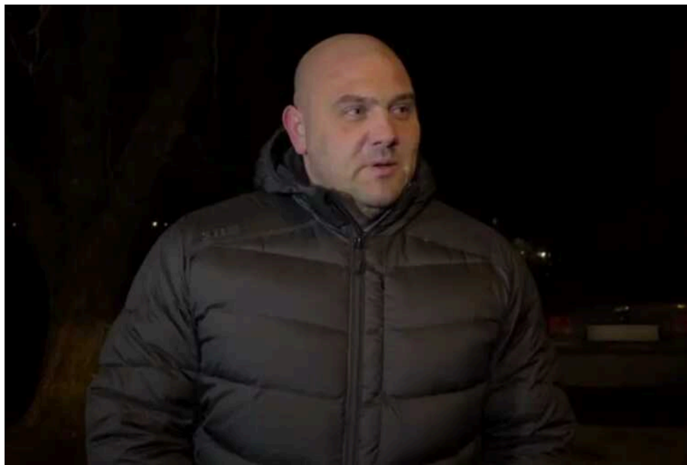
Атака БПЛА на Дніпро: пошкоджено житловий будинок

Унаслідок атаки ворожих безпілотників у Дніпрі зафіксовано влучання в житловий будинок.