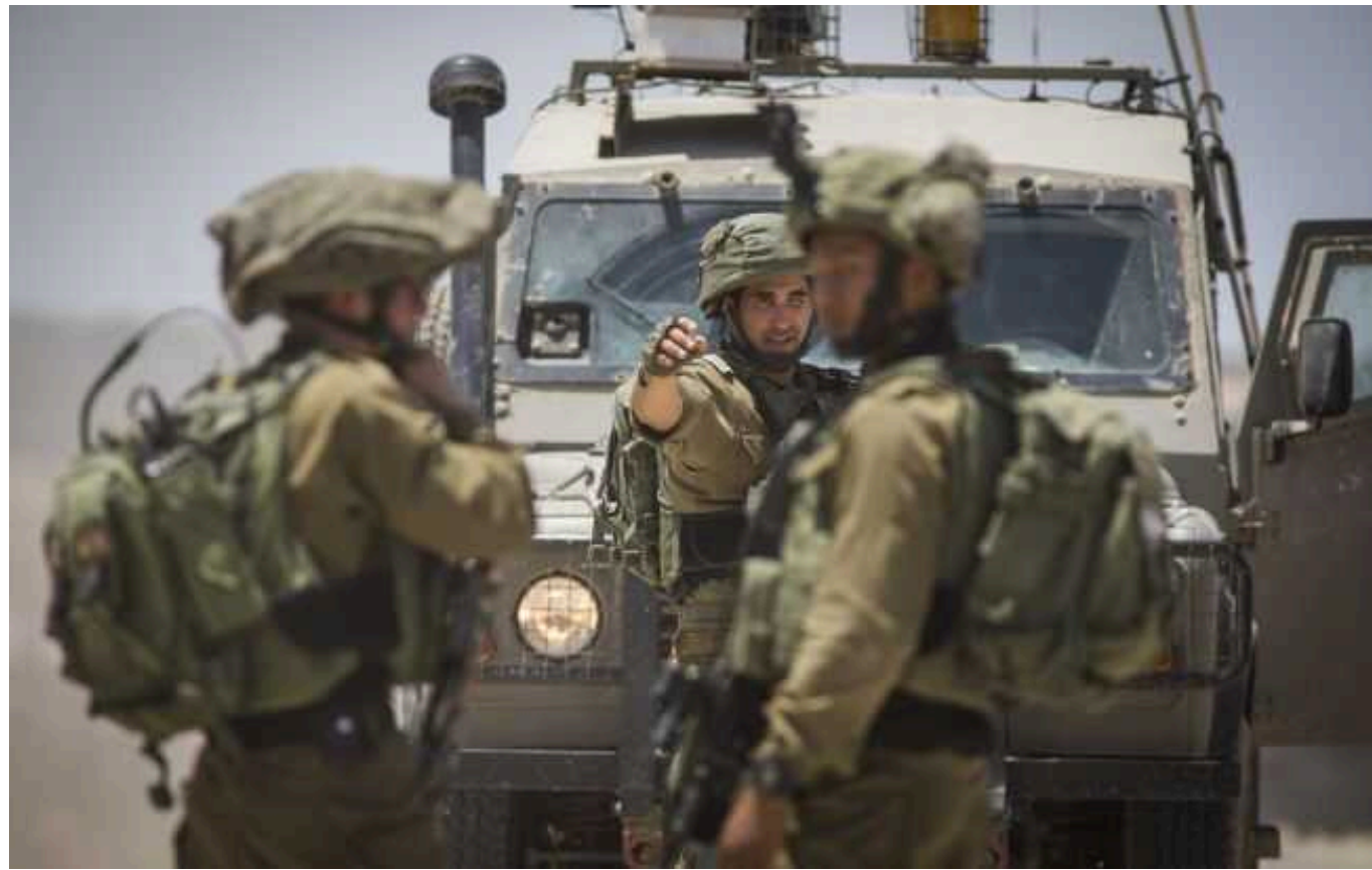
Армія Ізраїлю повністю ліквідувала "військову базу" ХАМАСу на півночі Сектору Гази

Ізраїльська армія завершила ліквідацію "військової структури" ХАМАСу в північній частині Сектора Газа.