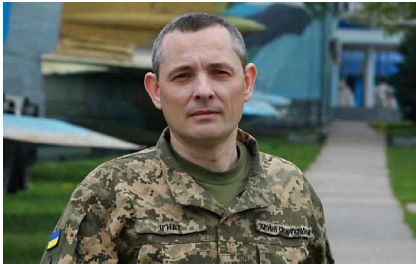
У Повітряних силах розповіли, де українські пілоти найшвидше завершать навчання на F-16

Станом на сьогодні існує три групи пілотів що навчаються на F-16. Кожна з них має індивідуальну програму підготовки.