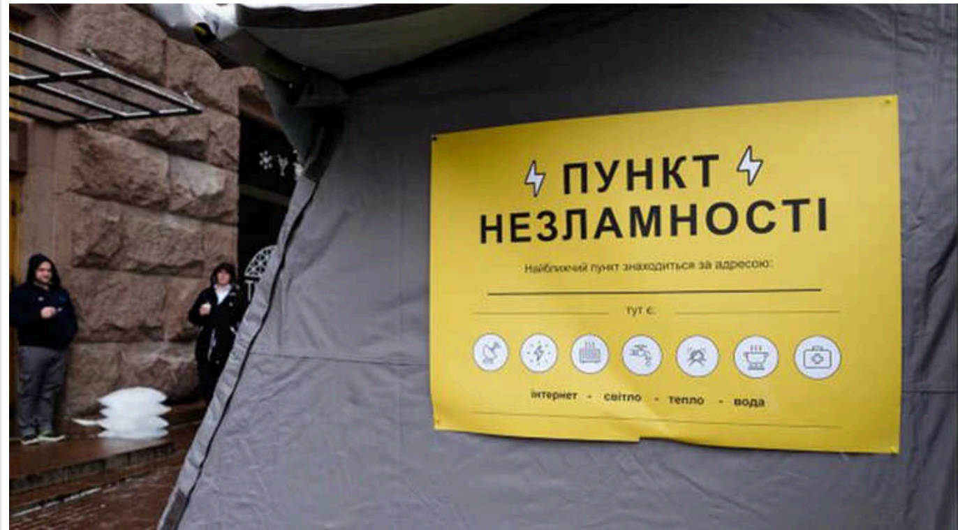
В Україні відкрито більше 12,5 тисяч Пунктів незламності, - Мініфраструктури

В Україні вже працюють 12 596 Пунктів Незламності, ще понад 700 готові до відкриття у разі необхідності.