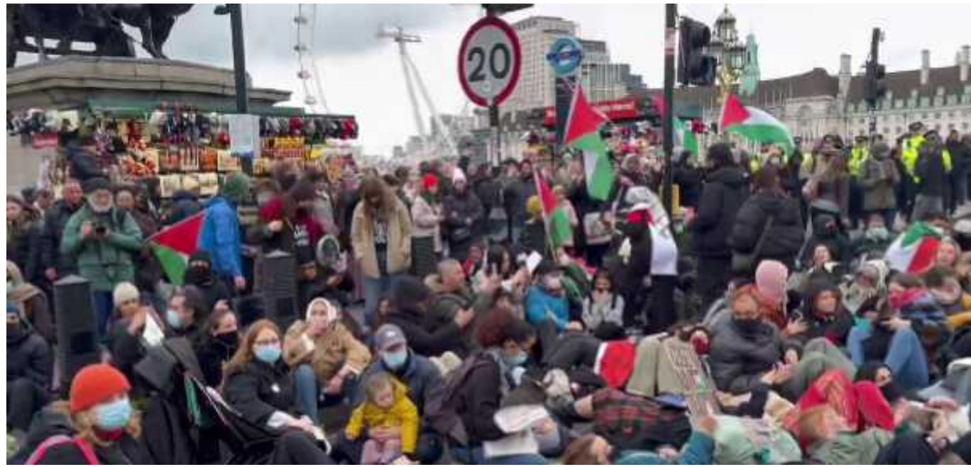
Біля парламенту Британії пропалестинські демонстранти перекрили міст

Пропалестинські протестувальники в суботу заблокували дороги біля британського парламенту, вимагаючи негайного припинення вогню у війні між Ізраїлем та терористичним угрупованням ХАМАС.