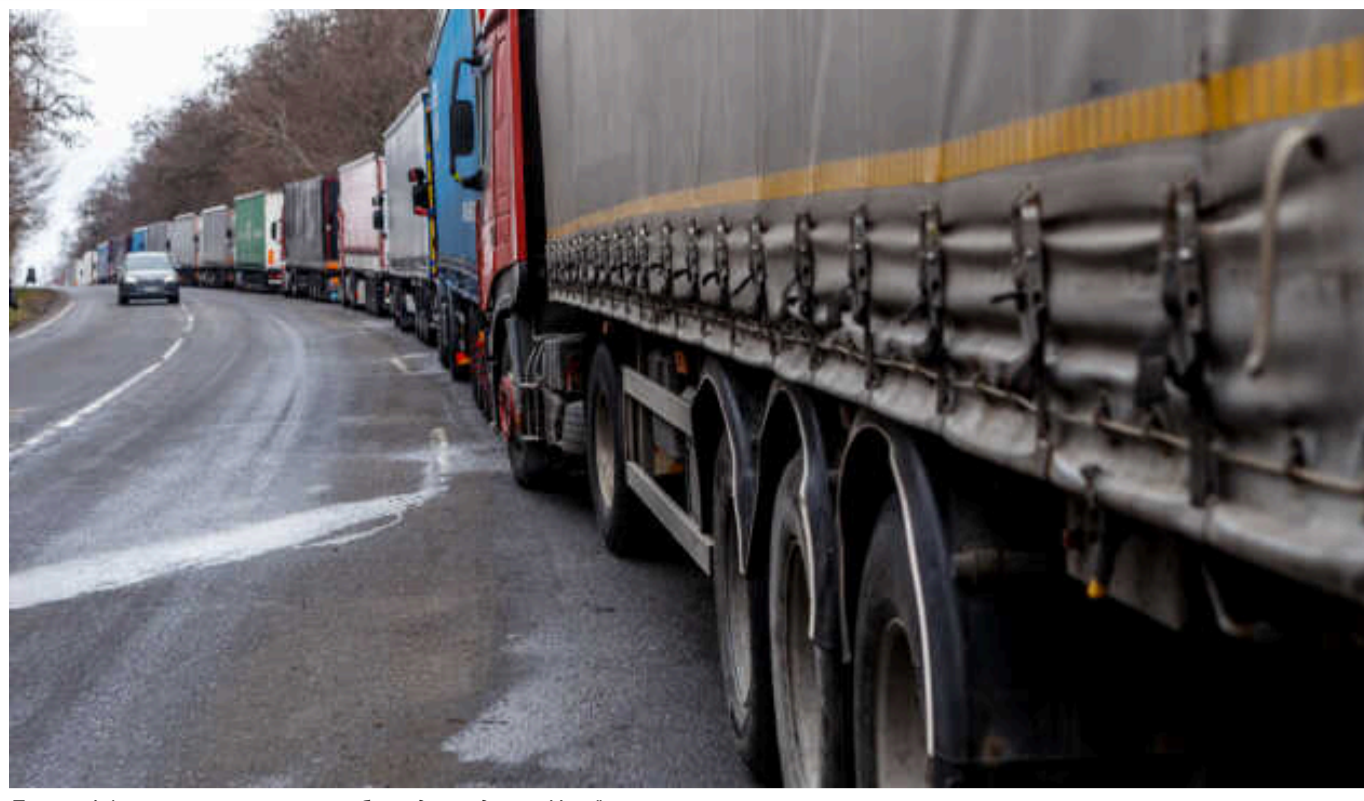
Польські фермери призупиняють блокаду кордону з Україною

Польські протестувальники, які блокували перехід "Медика-Шегині" на кордоні з Україною, призупиняють свою акцію. Це стало результатом сьогоднішніх домовленостей між ними та міністром сільськогосподарства Польщі Чеславом Секерським.