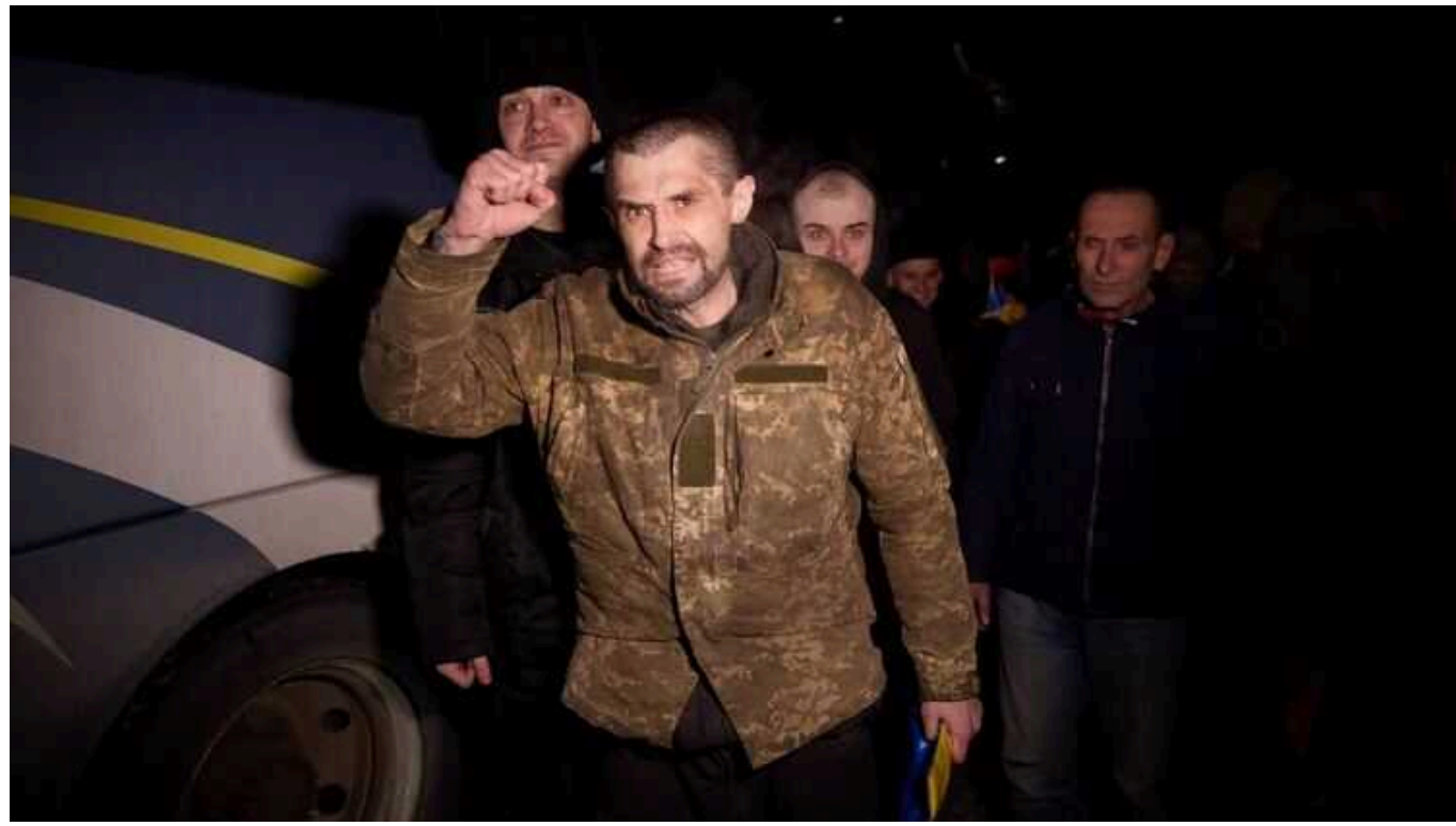
Пауза в обміні полоненими була через повернення командирів "Азова", що викликало невдоволення з боку Путіна - Венедиктів

Довга перерва між обмінами українськими та російськими військовополоненими виникла через повернення з Туреччини командирів "Азова" та 36-ї бригади морської піхоти, які потрапили в полон у Маріуполі.