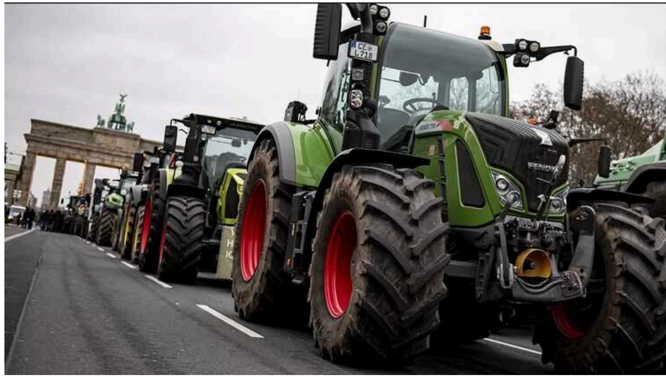
Через масштабний страйк фермерів у Німеччині очікують транспортний колапс

У Німеччині в понеділок, 8 січня, з 5:00 до 15:00 заплановано масштабний страйк фермерів на автомагістралях на півночі країни.