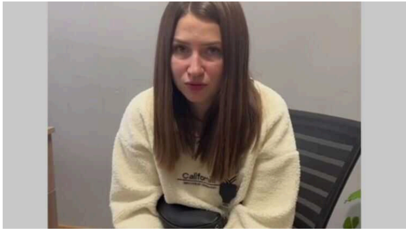
З'явилось відео з вибаченнями жінки, у якої співробітники ТЦК забрали чоловіка на блокпосту: "Соромно перед ЗСУ"

Жінка, у якої представники ТЦК забрали чоловіка на блокпосту на Закарпатті прямо з машини, шокувавши її саму та маленьку дитину, вибачилася.