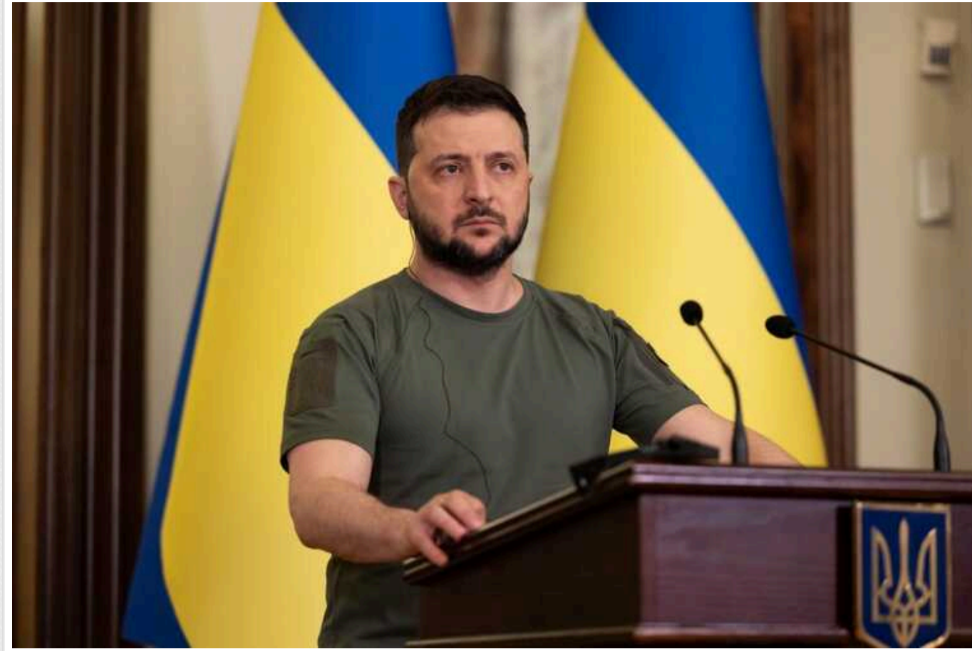
Багато влучних речей і все менше спокійних ночей в росіян, - Зеленський про українську зброю

Україна прагне розширити та збільшувати вітчизняне виробництво озброєння для сталого забезпечення Сил оборони засобами ураження російських загарбників. Чимало успішних ударів по ворожих цілях було завдано саме українською зброєю.