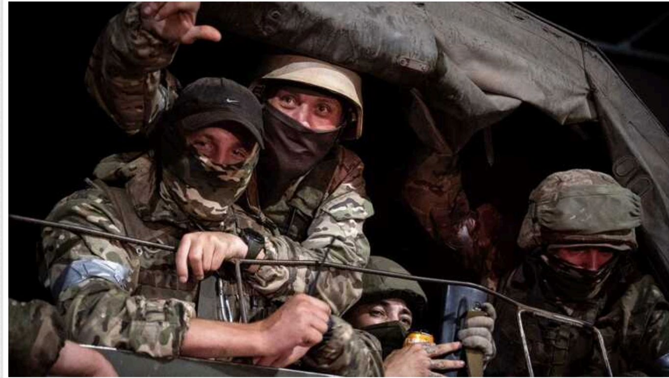
У РФ створили нову ПВК на заміну "вагнерівцям" і відправили у Запорізьку область, - Федоров

На базі російського підрозділу "Еспаньйола", що діє на тимчасово окупованій території Запорізької області в Україні, загарбники формують нову приватну військову компанію (ВПК) на кшталт "вагнерівців". Цим займається провладна партія країни-агресорки "Єдина Росія".