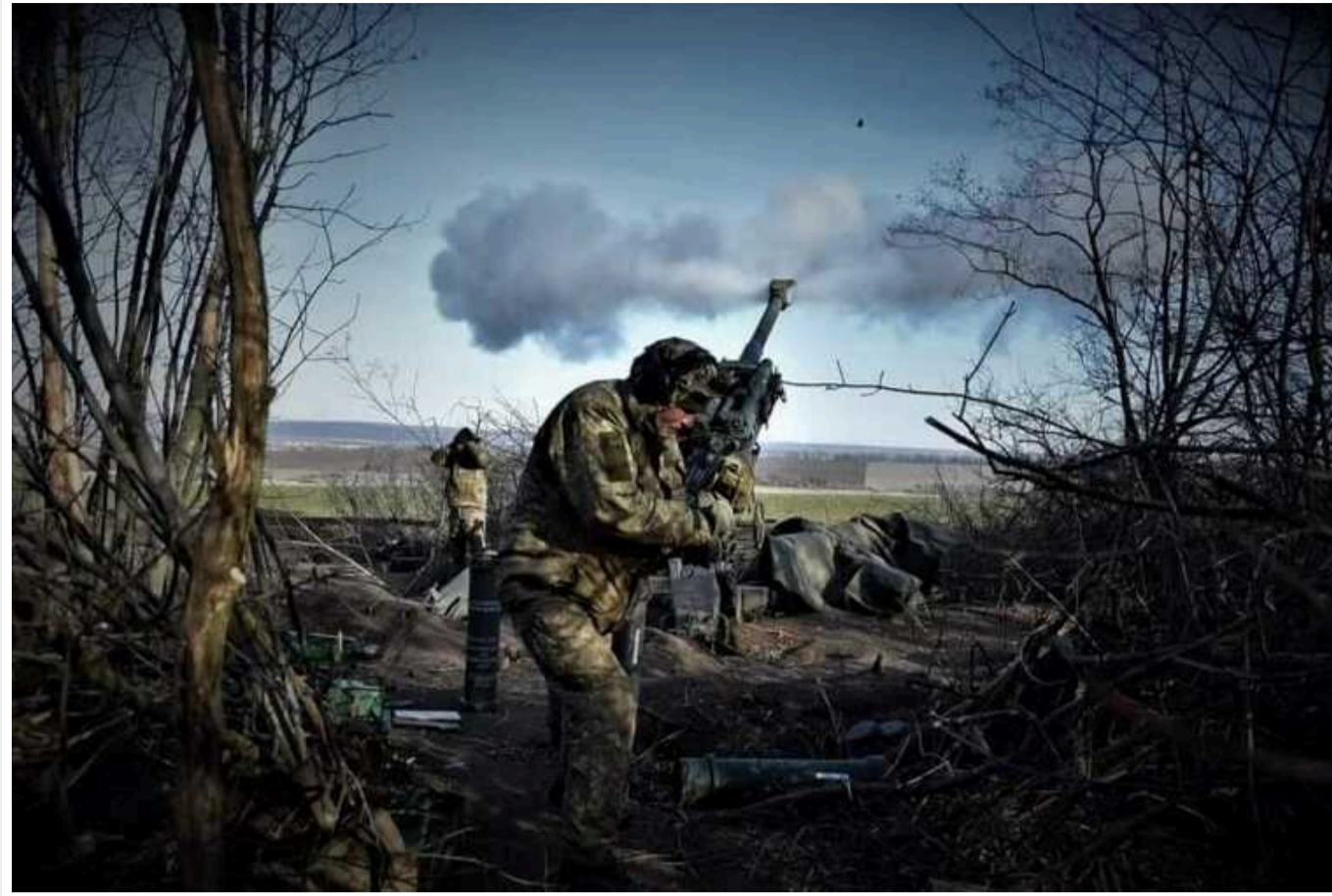
ЗСУ підірвали чотири гармати, якими окупанти обстрілювали Херсонщину

Група Репін та зведений загін "Коршунів" знищили чотири російські гармати на лівому березі Дніпра, на території тимчасово окупованої частини Херсонщини.