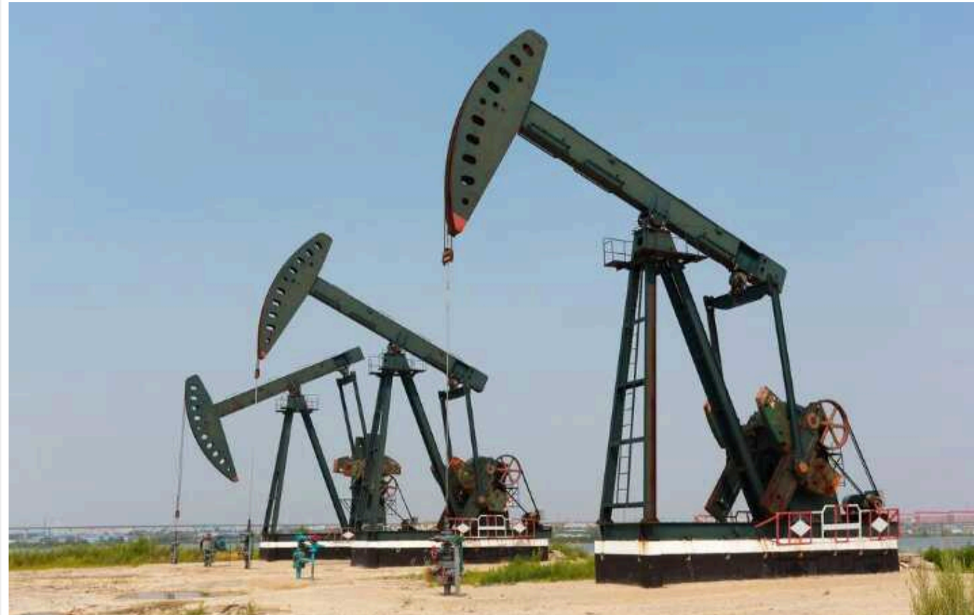
Иран призупинив продаж нафти Китаю: як це може вплинути на світові ціни

Торгівля Китаю нафтою з Іраном призупинилася, оскільки Тегеран припиняє поставки та вимагає від свого головного клієнта вищих цін, зменшуючи дешеву пропозицію для найбільшого в світі імпортера сирової нафти.