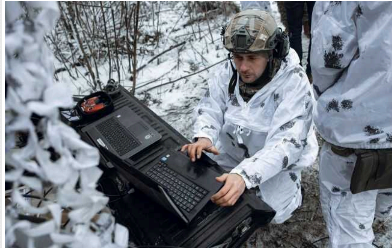
Ситуація на фронті: протягом доби відбулось 27 бойових зіткнень, ворог завдав 8 ракетних і 55 авіаційних ударів

Російські війська у суботу здійснили 18 безуспішних штурмових дій на позиції українських військ на лівобережжі Дніпра на Херсонщині, іще 14 ворожих атак відбито на Авдіївському напрямку.