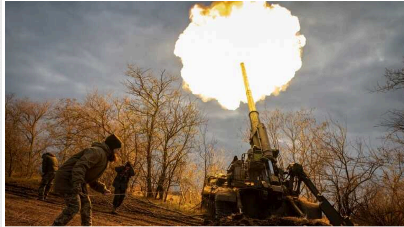
Окупанти проводять щоденні штурми Синьківки на Куп'янському напрямку, але успіху не мають, – Фітьо

Успіхів на Куп'янському напрямку поблизу Синьківки ворог не має, хоча і веде активні бойові дії.