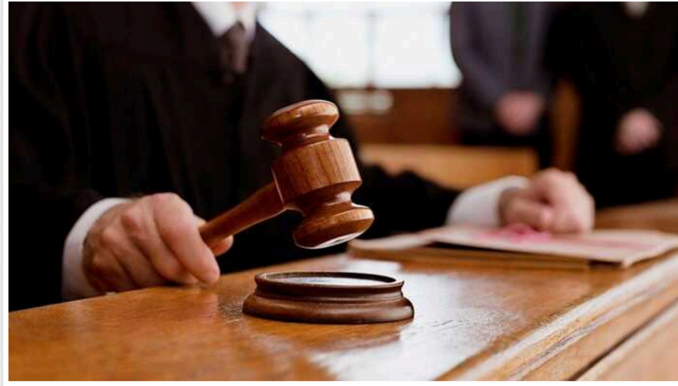
У Хмельницькому засудили подружжя за спробу продати в трудове рабство трьох громадян

Хмельницький міськрайонний суд розглянув у судовому засіданні кримінальне провадження з обвинувачення подружжя хмельничан в торгівлі людьми за ч. 2 ст. 149 Кримінального кодексу України. Діяльність зловмисників у 2022 році припинили слідчі слідчого управління ГУНП в Хмельницькій області, спільно з оперативниками відділу міграційної поліції.