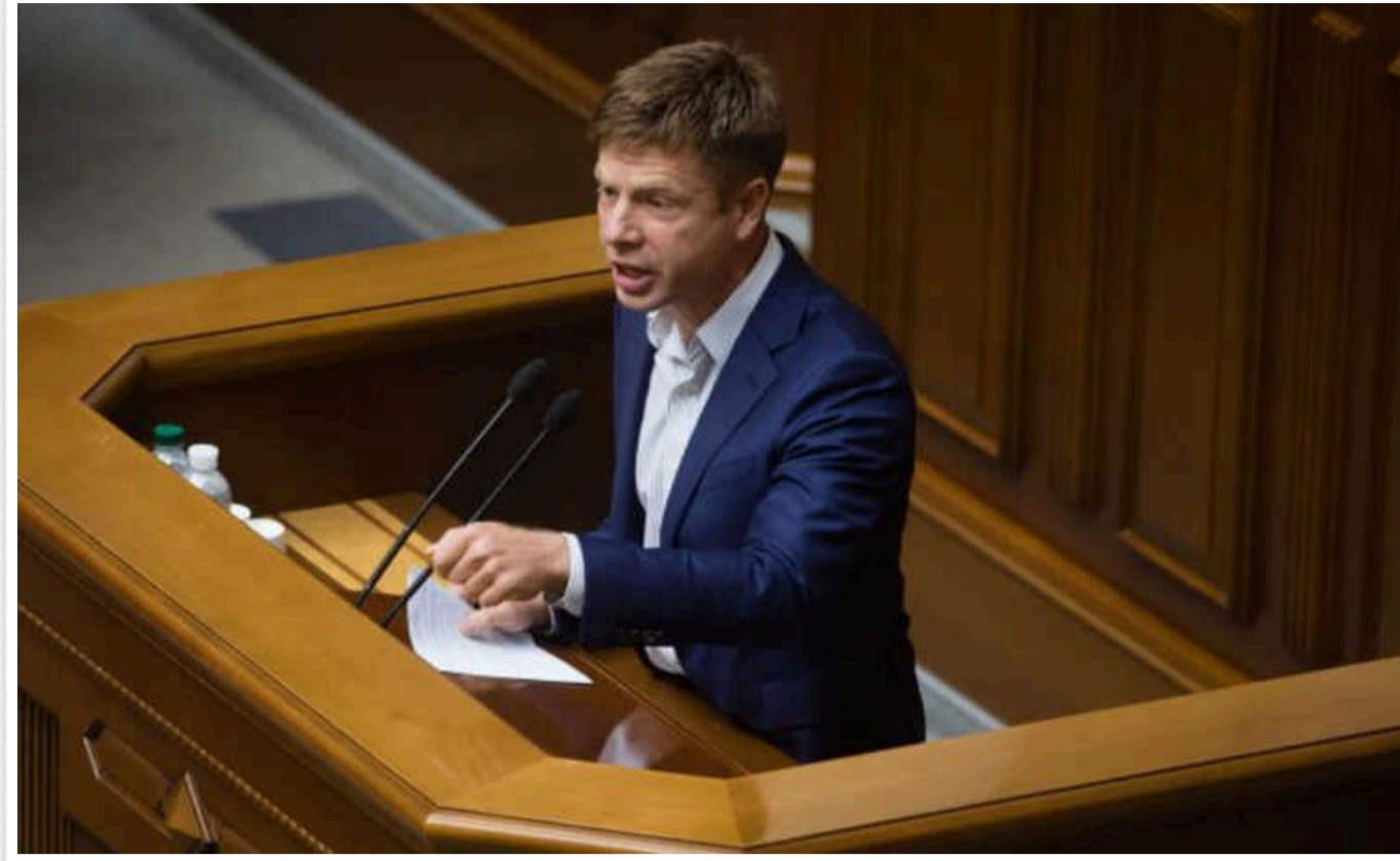
У 2024 році на зарплати військовим не вистачає 430 мільярдів гривень, – Гончаренко

На засіданні Комітету з нацбезпеки озвучили інформацію щодо дефіциту бюджету Мініборони на 2024 рік.