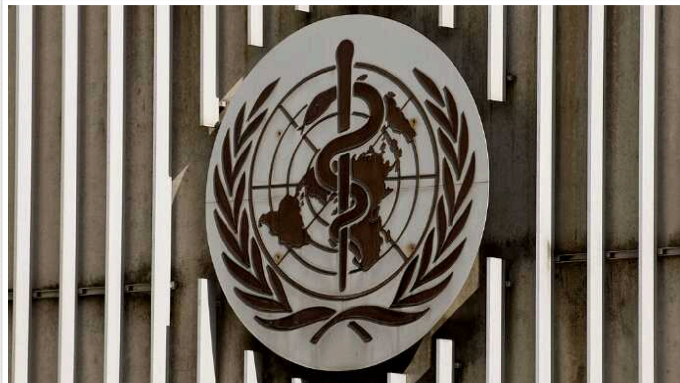
У ВООЗ закликають повернутися до носіння масок через зростання захворюваності на COVID-19

Всесвітня організація охорони здоров'я рекомендує поновити деякі карантинні заходи на тлі зростання захворюваності на COVID-19 та деякі інші хвороби, пов'язані з дихальними шляхами.