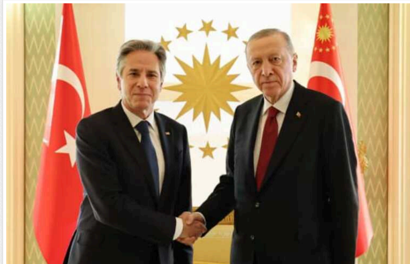
Блінкен зустрівся з президентом Туреччини перед поїздкою до Греції та на Близький Схід

Державний секретар США Ентоні Блінкен зустрівся в суботу з президентом Туреччини Реджепом Тайпом Ердоганом напередодні візиту до Греції та тижневої поїздки, спрямованої на заспокоєння напруженості, яка зросла на Близькому Сході.